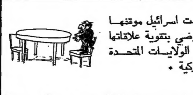
دعمت اسرائيل موقفها التفاوضي بتقوية علاقاتها مع الولايات المتحدة الاميركية